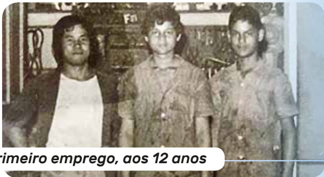
Primeiro emprego, aos 12 anos

Aos 12 anos, teve seu primeiro emprego no Autoelétrico Carlos, na mesma rua em que morava. Dois anos depois, foi trabalhar no Autoelétrico Sasaki, reformando baterias.