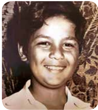
Eu, aos 8 anos, em 1973