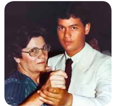
Minha mãe e eu no baile dos formandos do ensino médio, em 1984

Nasci em uma família bastante simples, numerosa e muito batalhadora. Éramos 10 irmãos - os Barduco Cugler, os Simoni Cugler e os Simoni Lopes. Nem todos do mesmo sangue, mas todos criados juntos, sempre unidos e cercados de muito amor.